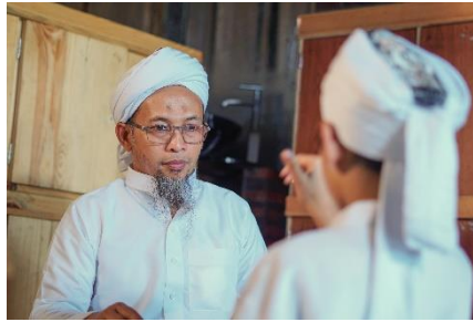
Gambar 2. Tahap pengenalan huruf hijaiyah isyarat

Pada tahapan belajar yang pertama tersebut terlihat ustadz pembimbing mengakomodir kebutuhan belajar anak dengan hambatan pendengaran dengan memfasilitasi gaya belajar mereka. Gaya belajar visual dan kinestetik menjadi penekanan dalam tahapan pengenalan huruf hijaiyah isyarat ini. Yahya & Noor (2015) menjelaskan bahwa guru perlu mengadaptifkan pembelajaran berdasarkan gaya belajar siswa sehingga dapat membantu siswa belajar lebih mudah dan dapat meningkatkan kemajuan pembelajaran. Huruf hijaiyah isyarat yang digunakan dapat dengan mudah diterima dan digunakan anak dengan hambatan pendengaran dalam belajar Al Qur'an dengan mengoptimalkan kemampuan visual dan kinestetik mereka.