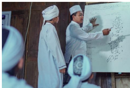
Gambar 3. Tahap mengurai dan merangkai huruf hijaiyah isyarat

Tahapan yang kedua (b) setelah tahap pengenalan huruf hijaiyah isyarat adalah tahap mengurai dan merangkai huruf. Dalam tahapan kedua ini anak dengan hambatan pendengaran dibimbing mengidentifikasi huruf apa saja yang menyusun ayat dalam Al Qur'an serta merangkai huruf untuk disusun menjadi ayat dalam Al Qur'an. Proses mengurai dan merangkai huruf ini sangat bergantung pada kemampuan anak mengenal huruf hijaiyah isyarat pada tahapan sebelumnya. Gambar 3 berikut merupakan gambar yang menjelaskan bagaimana tahapan mengurai dan merangkai huruf hijaiyah isyarat dalam tahapan belajar Al Quran menggunakan huruf hijaiyah isyarat :