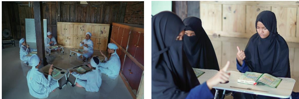
Gambar 4. Tahap membaca dan menghafal Al Qur'an

Pembimbingan tersebut dilakukan dengan pendekatan personal oleh ustadz pembimbing kepada setiap anak dengan hambatan pendengaran melalui kegiatan “setoran” hafalan. Berikut adalah gambar 4 yang menjelaskan tahapan ini :