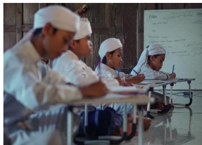
Gambar 5. Tahap menulis Al Qur'an (Kitabah)

Tahapan keempat (d) dalam tahapan belajar Al Quran menggunakan huruf hijaiyah isyarat ini adalah tahapan kitabah yakni tahapan dimana anak dengan hambatan pendengaran menuliskan kembali hafalan Al Qur'an yang telah mereka hafalkan. Tahapan kitabah ini menjadi tahapan akhir setelah anak dengan hambatan pendengaran melalui ketiga tahapan sebelumnya. Kemampuan anak dengan hambatan pendengaran dalam tahapan kitabah ini akan sangat berkaitan dengan penguasaan kompetensi pada tahapan sebelumnya. Selain menguatkan kemampuan anak dengan hambatan pendengaran dalam merangkai huruf, tahapan kitabah ini juga diarahkan untuk membantu anak dengan hambatan pendengaran menguatkan hafalannya. Gambaran secara umum tahapan kitabah ini dapat dilihat dalam gambar 5 berikut: